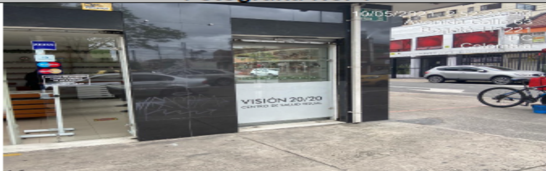
Avisos en ventanas