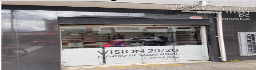
Avisos en ventanas