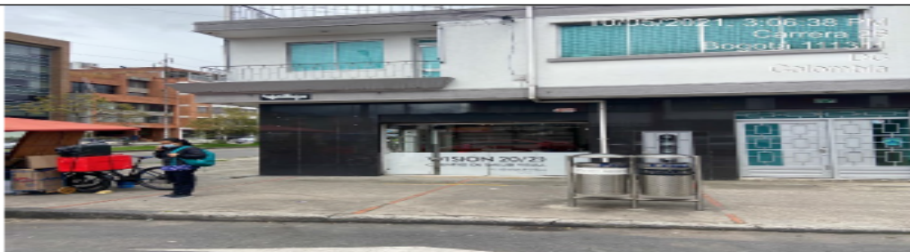
Fachada del establecimiento por Carrera